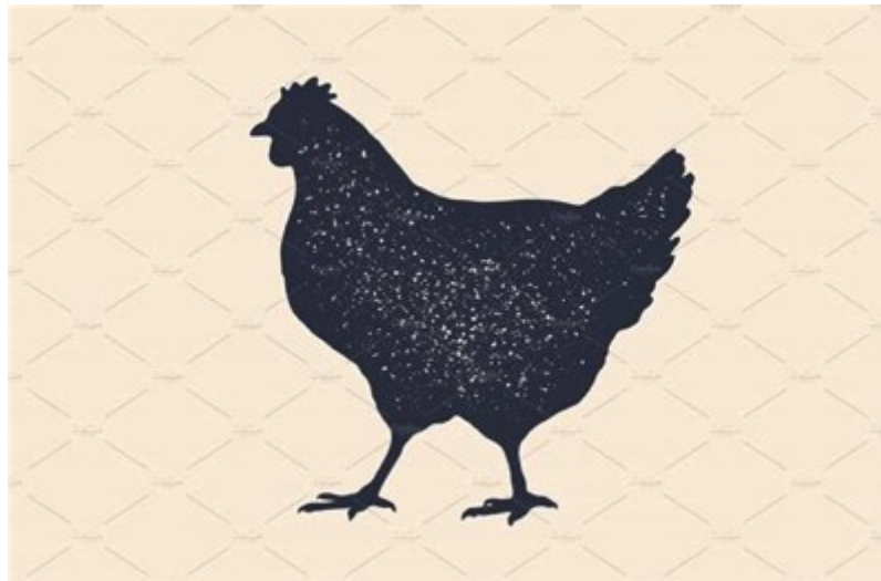
Hen / creative market - source internet

La langue joue sur la musique des pronoms personnels, pour les réunir en un « nous » final jubilatoire.