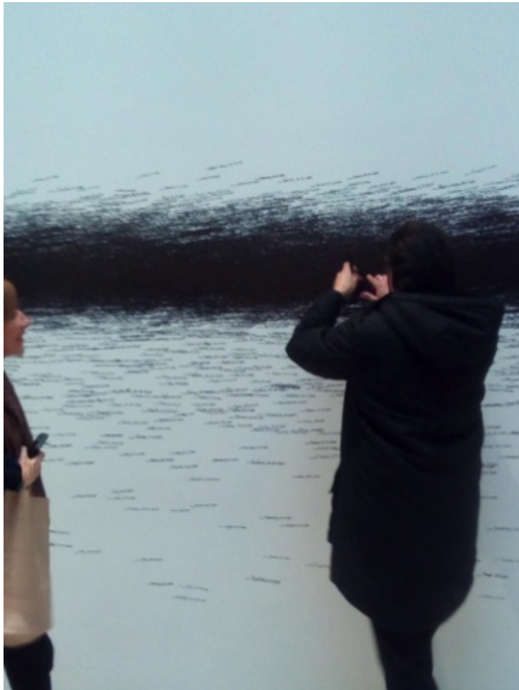
Etre moderne 2017 MoMA – Fondation Vuitton: Noms des visiteurs de l'exposition inscrits sur le mur. La ligne médiane de l'humanité?

Depuis deux ans, nous travaillons avec la Protection Judiciaire de la Jeunesse , au sein de la classe-relais des 12-16 ans, et conjointement, avec le groupe « ado » de la Maison théâtre à Montpellier : avec deux groupes d'adolescents-es clairement distincts par leur appartenance sociale et culturelle. Tenter de leur faire définir leur état des lieux personnels, leurs aspirations, leur regard sur l'avenir, leurs projections et les faire s'interroger sur l'image que la société projette sur l'adolescence, et donc sur eux... Tout cela donne naissance à des expérimentations, à des textes venant nourrir la recherche par une anthropologie de terrain, où elle fusionne avec ses sujets.