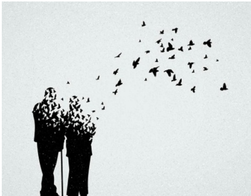
«comment la vie se finit-elle»

Lectures, dialogues théâtraux, dialogues à inventer et à écrire, retranscriptions : travailler avec lenteur et au rythme chaque jour qui s'impose, avec les résident.es / patient.es, les soignant.es, les accompagnant.es, les familles.