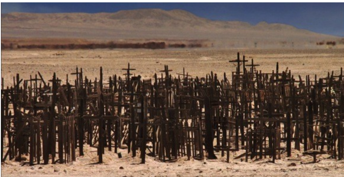
Désert de l'Atacama - Photographies issues du film «Nostalgie de la Lumière» de Patricio Guzman